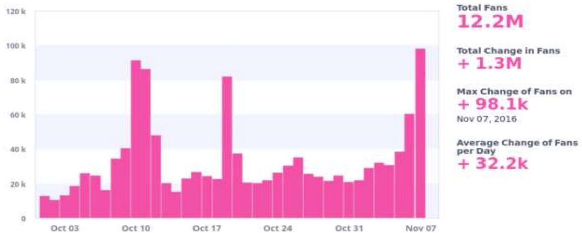
Growth of Total Fans

На следващата графика се вижда, че Тръмп успява дори в окото на бурята на секс скандала да увеличи размера на своята мрежа в социалните медии, като дори тогава позитивните ангажирания и споменавания за него са повече от тези за Клинтън.